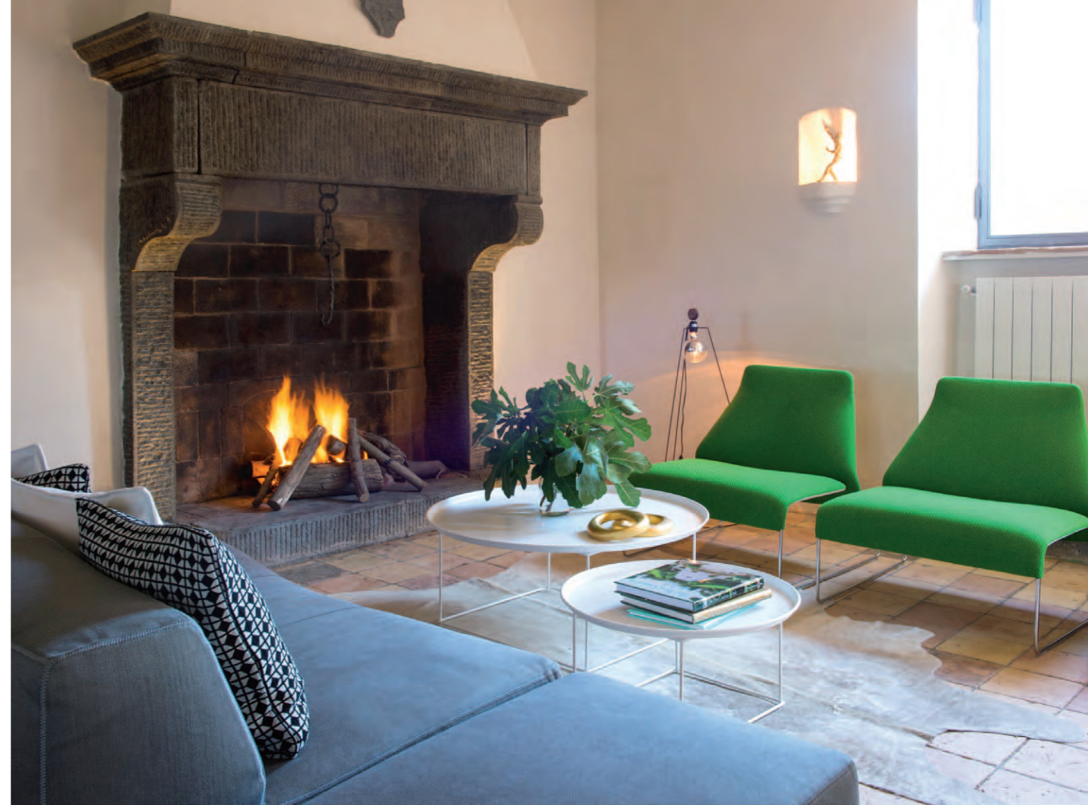
“תמונות” צומחות מאזוב בחוץ, אח מבווערת בפנים: בית בן 2,500 שנה

הצטיידו בכוס יין (רצוי איטלקי), התרווחו וקחו פסק זמן ראוי לטיול באחד המקומות היותר מרהיבים בעולם. זהו בית שבחלקו העליון יש פריטי עיצוב מהמאה ה-21, ובחלקו התחתון מערות בנות יותר מ-2,500 שנים.