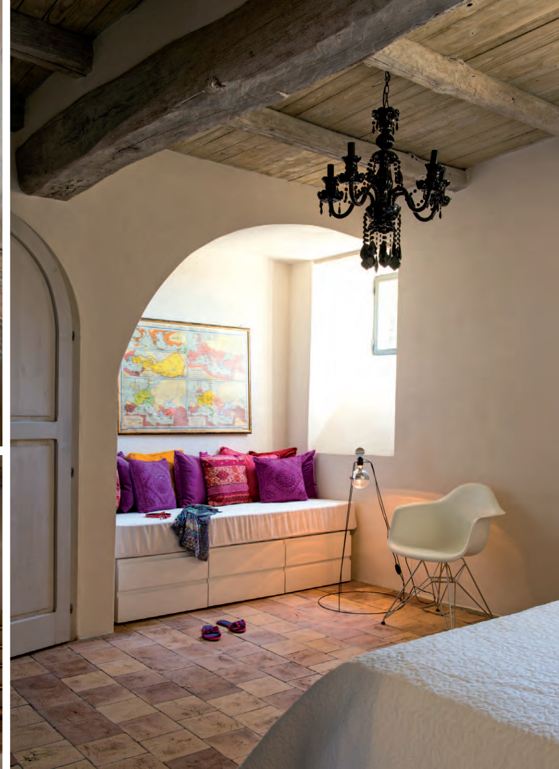
התקרות והרצפות חושפות את ההיסטוריה העשירה של הבית, והריהוט מוסיף להן את הרובד העכשווי