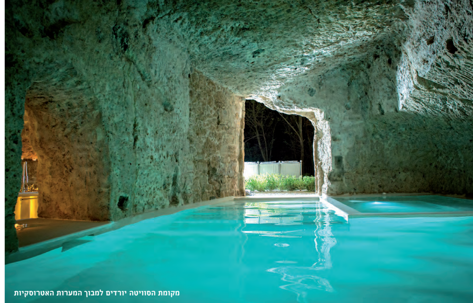
מקומת הסוויטה יורדים למבוך המערות האטרוסקיות

בחדר השני, כדי להוסיף עניין וצבע, נתלתה מפה עתיקה על הקיר. מתחת לס"פסל שיש לבן נבנו הללי אחסון, ומעל קצה הספסל מרחף מדף שיש שחור, שעליו מונח כיוור חדר הרחצה. בקומה התחתונה סוויטה עם סלון וחדר שינה, קשתות ושוב - רהיטים לבנים עם פריטים שמוסיפים צבע. כמו ביתר חרדי הרחצה, מראות מוזהות בסגנון עתיק מתחברות לקווים הנקיים של הריהוט. בנישות הקטנות מוצגות עבודות אמנות עכשוויות. מקומת הסוויטה יורדים למבוך המערות האטרוסקיות. ישורת המדרגות הראשונה משמשת כמרתף יין. לצדה שתי מערות, אחת מוקדשת למדיטציה והשנייה - גלריה לאמנות. מהמערות חוזרים לגינה, לגיבו ולפינות הישיבה והאוכל שבחוף. ליד הגינה יש בריכה ומטבח. הבריכה המחוממת והג'קוזי נמצאים במערה שבה אגרו הרומאים מים, ומקומת הסוויטה התחתונה יש יציאה לגן. אם מתחשק לכם ליהנות מהאווירה החלומית, תוכלו לשכור את הבית לשבוע שלם (הוא לא מושכר לימים בודדים): התענוג יעלה 5,450 דולר לשבוע בעונת השיא, 4,450 דולר בתקופת Mid Season, ו-3,250 דולר בתקופת השפל. נשמע יקר? אם שלושה זוגות מאכלסים את שלוש הסוויטות, זה זול משמעותית ממחירו של חדר במלון בישראל. כראי להודרו, כי רוב השנה כבר תפוסה. כתובת האתר: http://domuscivita.com